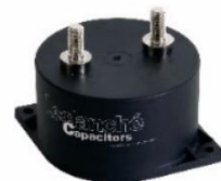
高電圧フィルム コンデンサ