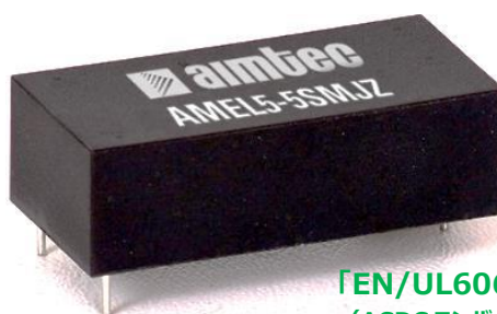
「EN/UL60601-1」認定品 (ACDCコンバータ: AMLE5-MJZ シリーズ) 53.80 x 28.80 x 19.00mm