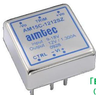
「EN/UL62368-1」認定品 (DCDCコンバータ: AM15-Z シリーズ) 25.40 x 25.40 x 10.16 mm

ノイズフィルタ : 機能性を重視した製品ラインナップ。2020年新製品あります。