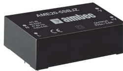
3相アプリケーションに適したAME10/20-BJZシリーズ

広範囲な動作周囲温度： -40℃ ~ 85℃ 高出力密度： 5W、10W、20W 全て同じフットプリントサイズ 低EMI： 感度の高いテレコムアプリケーションに最適 入出力間絶縁耐圧値： AC4000V MAX