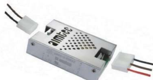
AMEC15-MAZ 組込み型 コネクターパッケージ付き