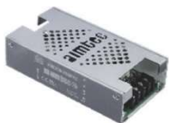
MES-30-MAZ 組込み型 ネジ端子付き