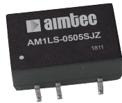
完全刷新した1W 低パワーウィンモデルのSMDパッケージ

ラインナップ： 約7700機種 (1W~3W対応品:4000機種以上) 出力： 1/4W~200W (SMDは1/4Wから3Wまで) 入力範囲： 最大1500VDC (±10%、2:1、4:1、最大10:1) 入力/出力絶縁： 1000~6000VDC、最大5000VAC 動作周囲温度： -40℃ (低温起動) ~ 125℃ 実装ピン寸法： 産業機器標準ピンピッチ構成 多種多様なパッケージ： SIP、DIP、SMD、1X1インチ、2X1インチ、2X1.6インチ、2X2インチ、クォーターブリック、ハーフブリック