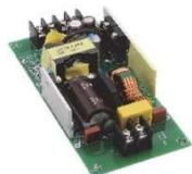
AMEQS40-MAZ オープンフレーム式 ネジ端子付き