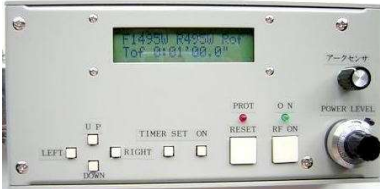
写真は7ヶ所設定つまみ付の特別仕様品です